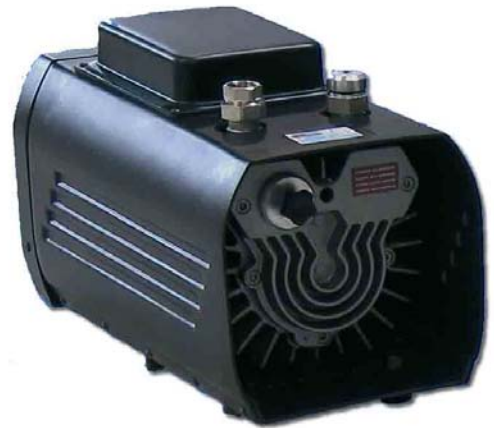
25 S (150 mbar)